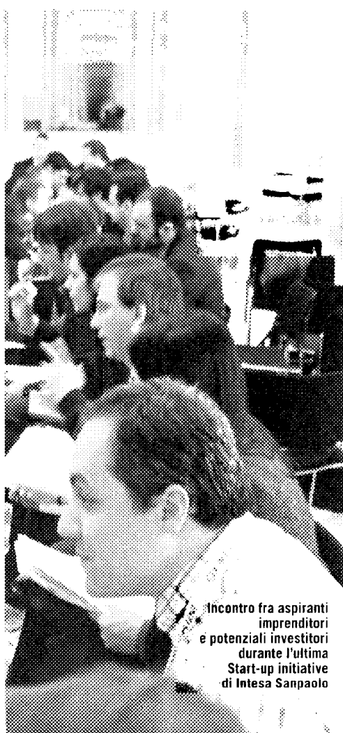
Incontro fra aspiranti imprenditori e potenziali investitori durante l'ultima Start-up Initiative di Intesa Sanpaolo